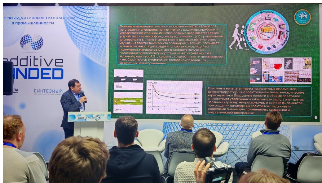
Рис. 6. Доклад «Управление свойствами 3D-печатных полимерных структур»

Второй кейс касался 3D-печати полимерных электротно-пьезоэлектрические структур (рис. 6). Полимерные материалы по-прежнему являются основой для изготовления электретов, применяемых в микрофонах, сенсорах и других устройствах электроники [7]. Успехи по 3D-печати пьезоэлектретов уже есть [8, 9]. Введение дисперсных, в том числе наноразмерных, частиц в полимерную матрицу позволяет существенно улучшить электретные свойства за счет модификации структуры энергетических ловушек инжектированных носителей зарядов. В докладе было показано, что пластинки, напечатанные из композитных филаментов с заданной рецептурой, демонстрируют повышенные электретные и пьезоэлектрические характеристики. Особое значение имеет присутствие воздушных полостей в объеме 3D-печатных пластинок, которое способствует повышению стабильности заряда электретов. Комбинация контролируемой микроструктуры (включая пористость и ориентацию слоев) и подбора состава филамента обеспечивает формирование материалов, перспективных для сенсорной и энергетической электроники, включая датчики деформаций, элементы сбора вибрационной энергии и др.