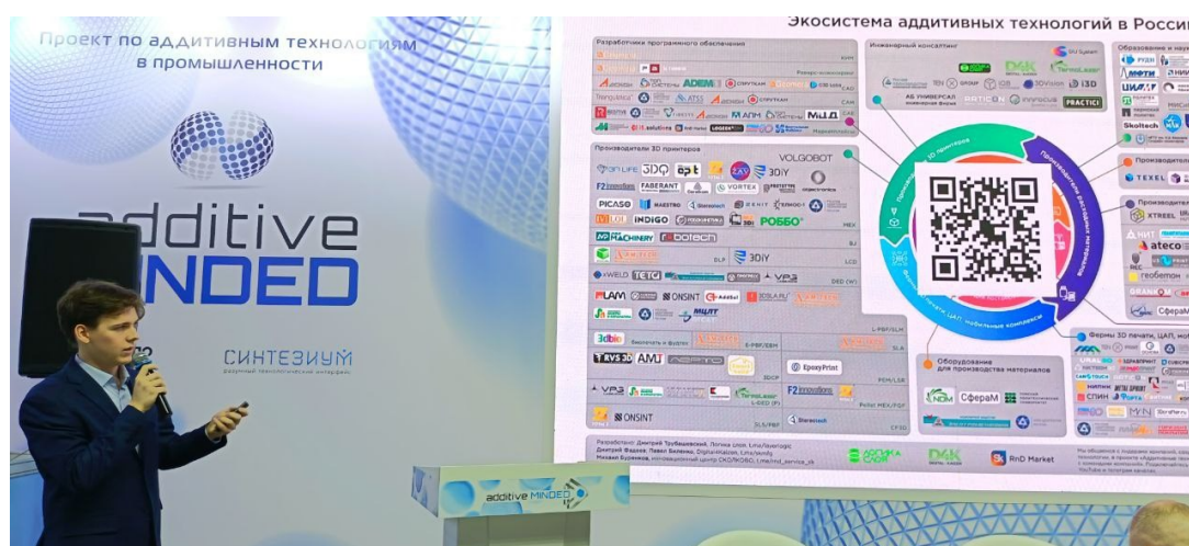
Рис. 4. Доклад деловой программы Additive Minded-2026

Многофункциональные центры (AM.TECH) объединяют проектирование, печать и постобработку, обеспечивая доступ к технологиям в регионах. Отрасль завершает переход от прототипирования к полноценному элементу промышленной экосистемы (рис. 4).