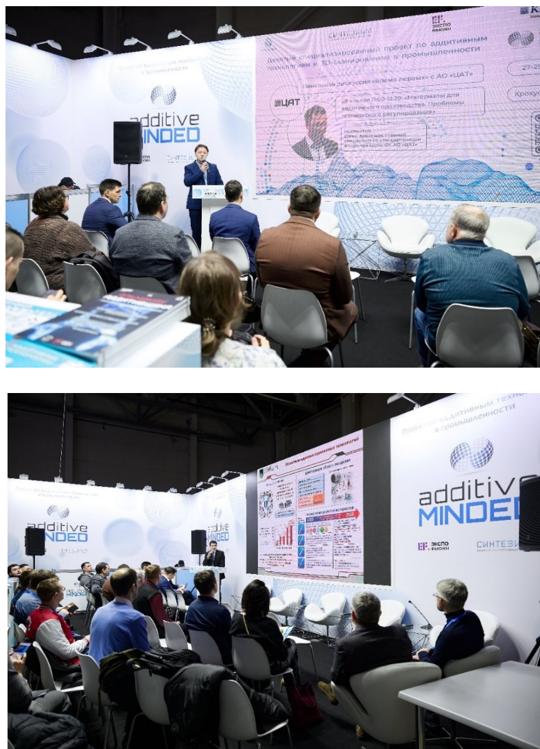
Рис. 3. Доклады деловой программы Additive Minded-2026

на ближайшее десятилетие. В условиях глобальных трансформаций промышленности российский сегмент аддитивных технологий продемонстрировал переход от стадии импортозависимого прототипирования к этапу технологического суверенитета и интеграции в серийные производственные циклы.